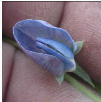
Græsfladbælg, Lathyrus sativus , VIR FS661