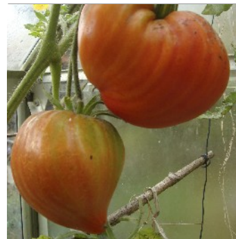
Tomat, Lycopersicon esculentum , Bytje Serdtse, FS557