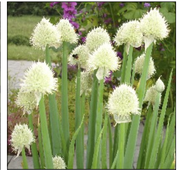
Pibeløg, Allium fistulosum , usn