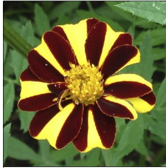
Fløjlsblomst, Tagetes , Pinwheel Metamorph