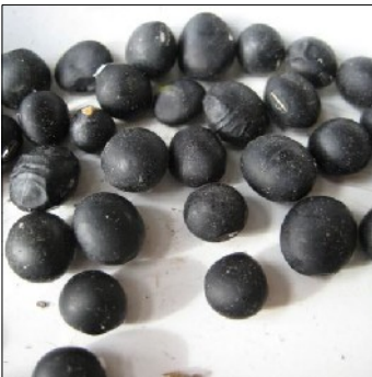
Soyabønne, Glycine max , Kuromame