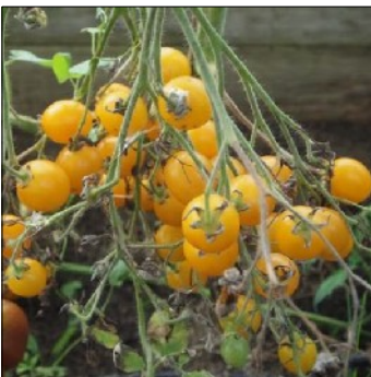
Tomat, Lycopersicon esculentum , Ildi, FS533