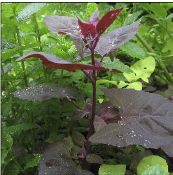
Havemælde, Atriplex hortensis , 'rød havemælde' FS040