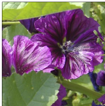
Mauretansk katost, Malva sylvestris var mauritanicus