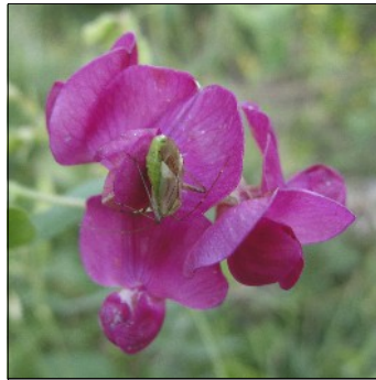
Knoldfladbælg, Lathyrus tuberosus , Slettebjerg 6, FS682