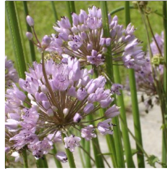
Nikkende løg, Allium nutans , 'Kinesisk purløg, usn' FS326