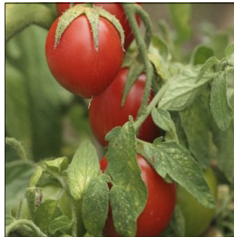
Tomat, Lycopersicon esculentum , Bellstar