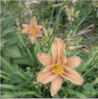
Daglilje, Hemerocallis , 'fra Højtvedgårds have'