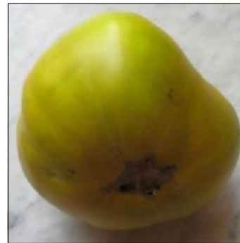
Tomat, Lycopersicon esculentum , Charles Green (Foto: MJ)