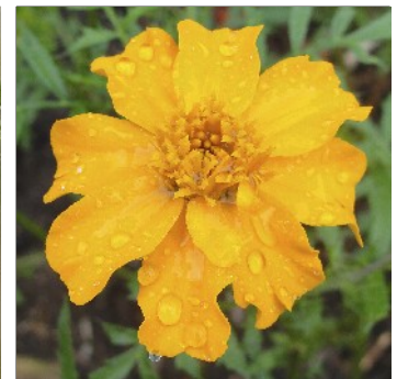
Fløjlsblomst, Tagetes , Suzannes enkle orange, FS210