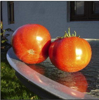
Tomat, Lycopersicon esculentum , Russie 3, FS101