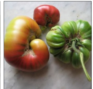
Tomat, Lycopersicon esculentum , Ananas Noir