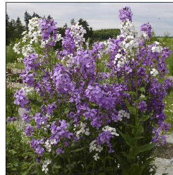
Aftenstjerne, Hesperis matronalis , FS558