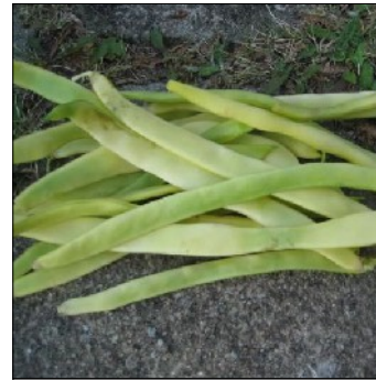
Havebønne, Phaseolus vulgaris , Beurre de Rocquencourt, FS609