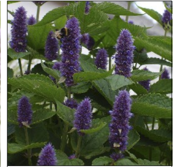
Anisop, Agastache foeniculum